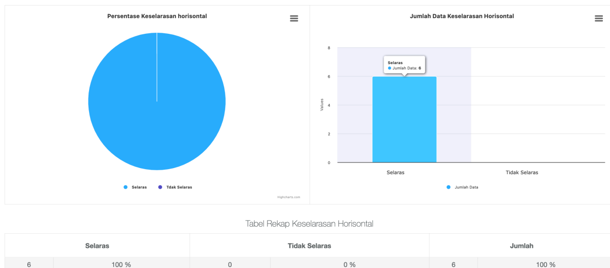
Gambar 2. Kesesuaian bidang kerja lulusan PS PFIS UT Tahun 2020

Berdasarkan data keselarasan horizontal tracer study , lulusan PS PFIS UT tahun 2020 telah mendapatkan pekerjaan yang sesuai dengan bidang studi yang mereka pelajari selama kuliah. Dari alumni yang terlacak, 100% alumni mendapatkan pekerjaan yang sangat berkaitan dengan program studi yaitu sebagai pendidik pada bidang ilmu fisika atau IPA Fisika di sekolah. Dimana 16,67% sebagai pendidik di Sekolah Dasar (SD) Sederajat, 33,33% pendidik di Sekolah Menengah Pertama (SMP) Sederajat, dan 50% sebagai pendidik di Sekolah Menengah Atas (SMA) Sederajat. Hal ini menunjukan daya saing mahasiswa PS PFIS UT dalam mendapatkan pekerjaan dalam bidangnya.